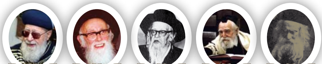
כ"ק האדמו"ר בעל "אמרי אמת" מגור הגאון רבי משה פיינשטיין דב בעריש וידענפלד הגאון מטשיבין רבי זלמן אויברך הגאון רבי שלמה זלמן אויברך ידלחט"א מרן הגאון רבי עובדיה יוסף