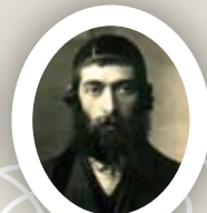
אביו הדיין בסוסנוביץ