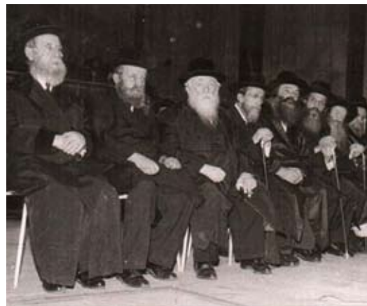
גדולי ישראל מפארים את עצרת המשנה היומית לפני כ־50 שנה

בשב"ק כ"א תמוז מסיימים רבבות יהודים את ששת סדרי המשנה ומתחילים למחרת את המחזור החדש במשנה היומית